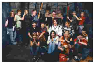
Projekt z realizace vnitřní školní v roce 2008

Rozvojový program Podpora výuky cizích jazyků ve školách ve školách v roce 2008