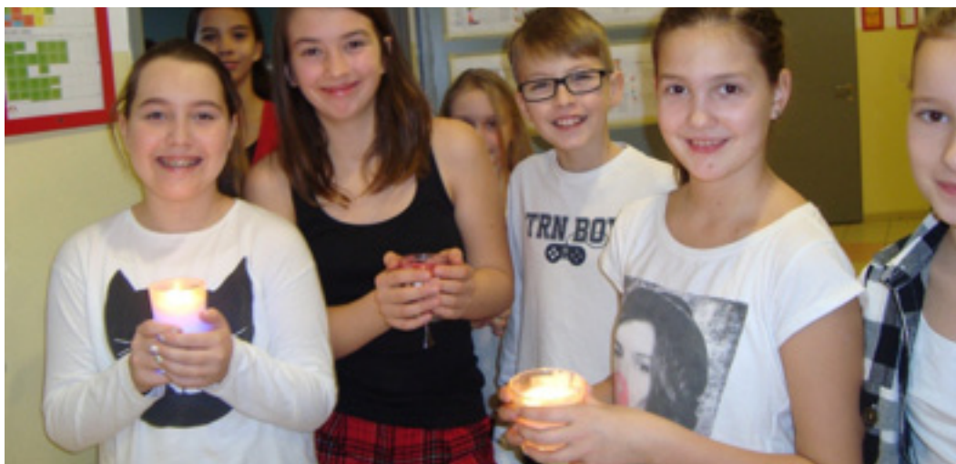
Fotografie: Vánoční hodina. Na dveřích jeden ze smajlíků využívaných pro reflexi.

Děti atmosféru ve třídě během párové výuky hodnotí jako přátelskou a hodiny si užívají. Byly by rády, kdyby se „párovka“ konala vícrát týdně.