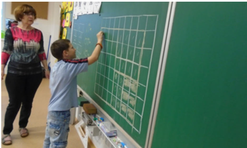
Fotografie: Jedna ze závěrečných reflexí

V prvním čtvrtletí pro nás bylo velmi náročné najít společný čas na přípravy, vyhodnocování, opravy pracovních listů nebo sešitů a na sebereflexi. Naučily jsme se využívat buď elektronickou komunikaci, nebo se sejdeme na kratší dobu, rozdělíme si úkoly na příští týden a ty pak každá samostatně připravíme.