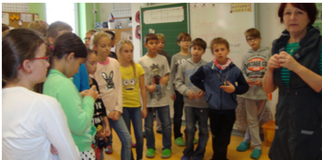
Fotografie: Využití prostoru chodby nebo vedlejší třídy

Díky tomu, že jsou některé hodiny koncipovány takto dynamicky, jsou žáci mnohem aktivnější a jednoduše řečeno nemají čas se nudit nebo nepracovat. V jiných hodinách se soustředíme spíše na expozici nové látky a na to, aby jí žáci porozuměli. I zde spatřujeme velký přínos párové výuky: žáci slyší totéž od dvou vyučujících, kteří se doplňují nebo třeba poradí jinou pomůcku, která žákům pomůže danou problematiku pochopit. V tomto směru je párová výuka přípravou na druhý stupeň, kdy se žáci budou setkávat s mnoha výukovými styly různých učitelů.