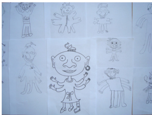
Fotografie: Kreslení podle pokynů spolužáka – práce žáků

Příkládáme ukázkou práce žáků. Obrázky se ve velké míře podobají originálu, tudíž jsme práci žáka, který diktoval ostatním pokyny, ohodnotily jako kvalitní.